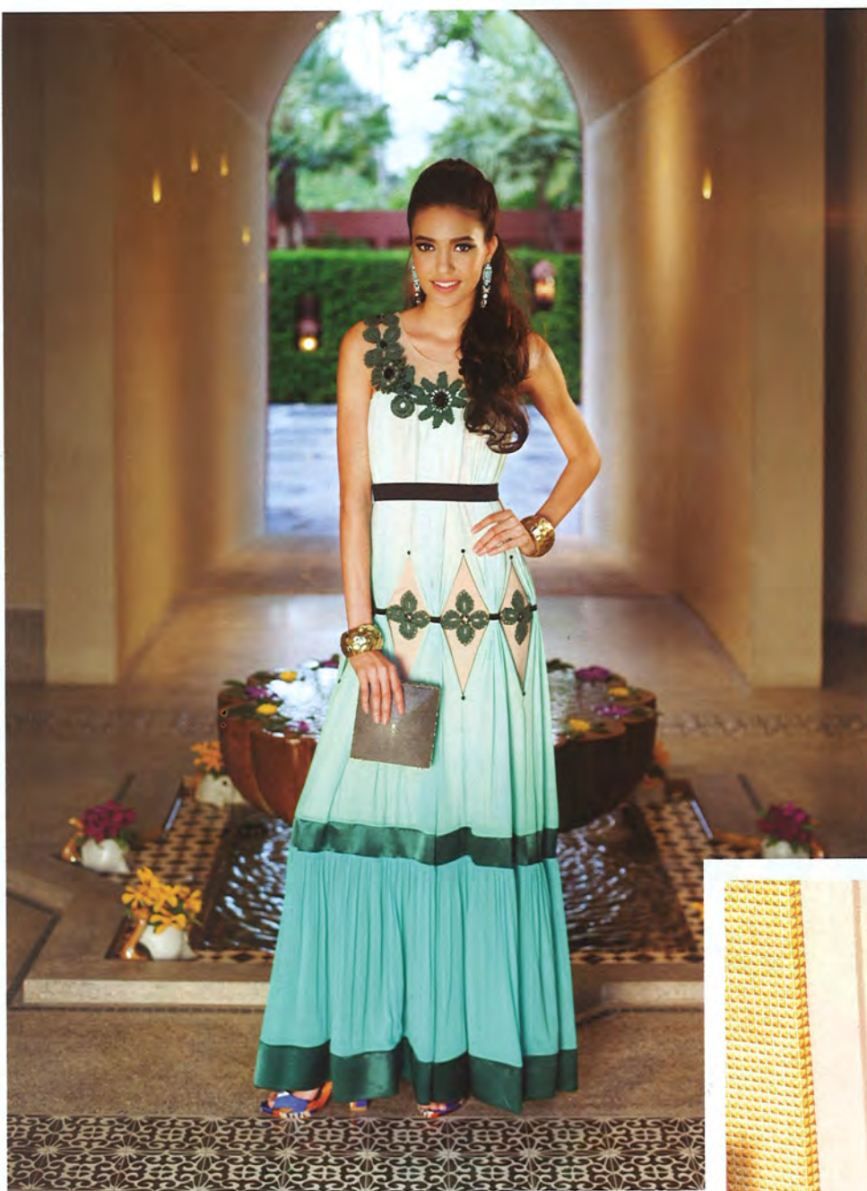
Top DRESS : OLANOR EARRING : VVASAINT SHOES : ZARA BRACELET : STYLIST'S OWN